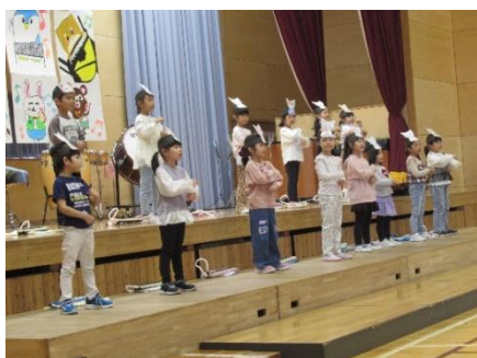
1年生 こいぬのマーチへんそうきよく 虹のむこうに

10月18日（金）、創立150周年記念ふるさと音楽会が行われました。保護者の皆様・来賓の皆様におかれましては、150周年の記念すべき音楽会にお越しいただきまして、大変ありがとうございました。どの学年も、音楽会へのめあてを持ち、心一つにして練習を重ねてきました。明るく柔らかな発声によるハーモニー、お互いの声や楽器の音を聞き合い心地よいブレンドのサウンドはとても素晴らしかったです。演奏する人、演奏を聞く人が一体となって音楽会をつくりあげていました。音楽は心を豊かにし、潤いを与えてくれます。そんな素敵で豊かな時間を全校で過ごし感じることができました。