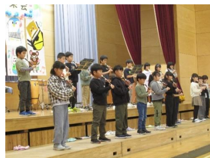
3年生 いちばん星みつけた 星唄 ほしぞらロケット 星笛