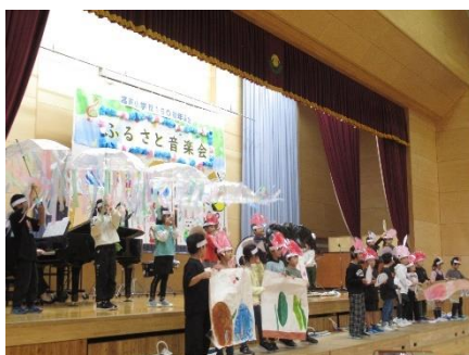
2年生 スイミー ～アンダー・ザ・シー～