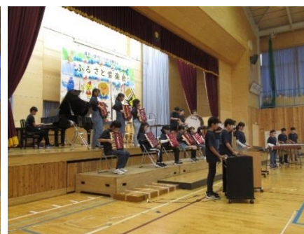
6年生 アラジンメドレー ふるさと