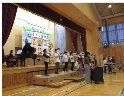
5年生 Bling-Bang-Bang-Born ぼくらのエコー