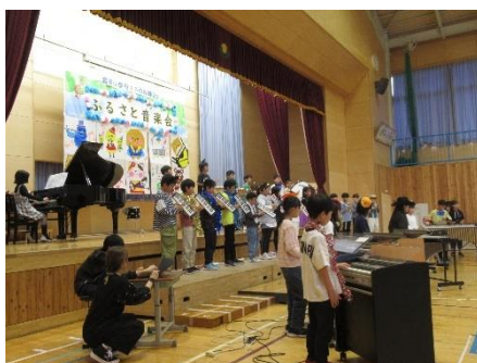
4年生 テキーラ 帰る場所